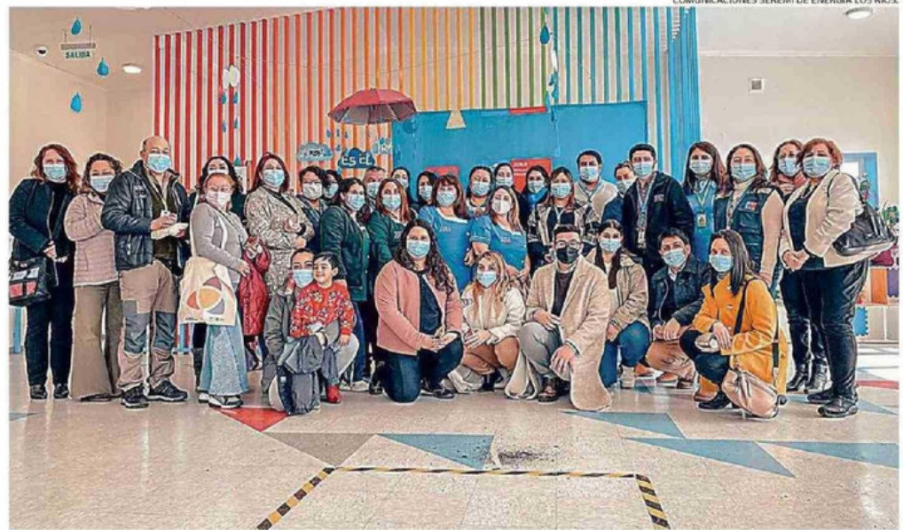
LA PRESENTACIÓN DEL PROGRAMA SE DESARROLLÓ AYER EN EL JARDÍN INFANTIL "RÍOS DE COLORES", DE VALDIVIA.