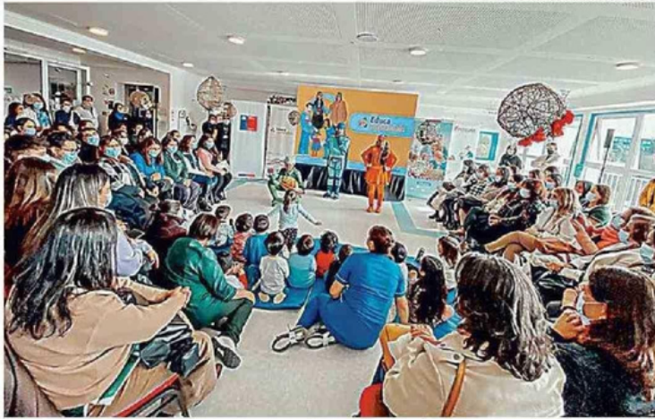
TRES SUPERHÉROES ENERGÉTICOS ANIMARON LA JORNADA EN EL JARDÍN INFANTIL.

y salas cuna serán incorporados al programa y contarán con una asesora en educación energética. Las comunas favorecidas serán La Unión, Río Bueno, Paillaco, Máfil, Los Lagos y Valdivia.