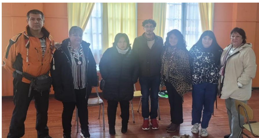
(Fotografía de los asistentes).