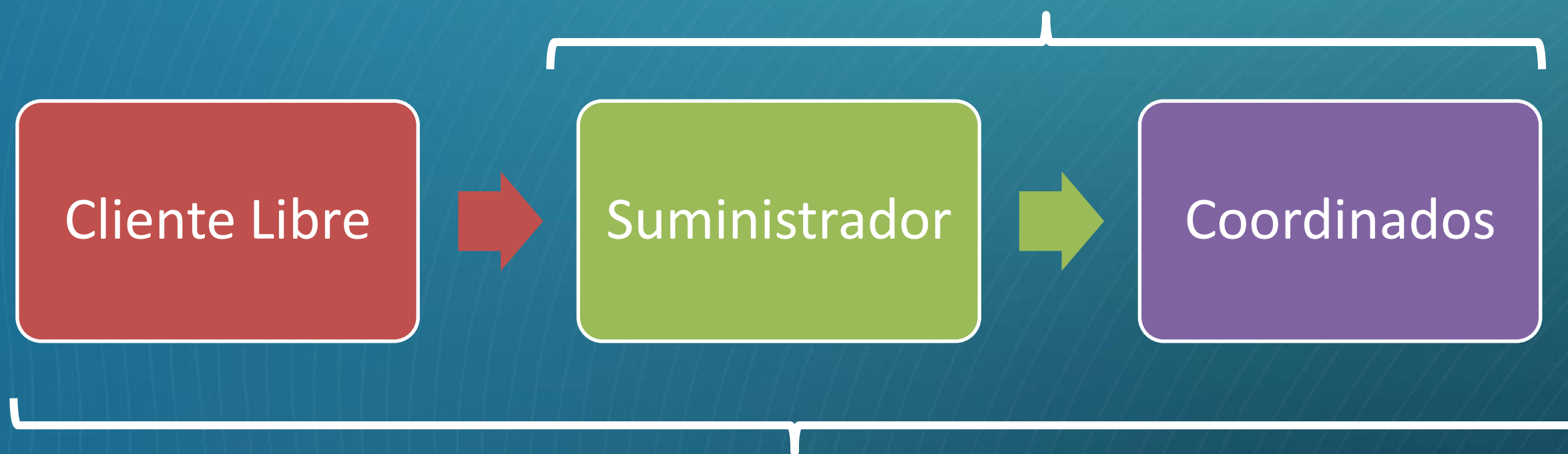
Cadena de Pagos que ve la Normativa

Incorporar a Cliente Libre en el Monitoreo de La Cadena de Pagos